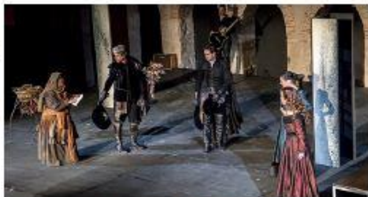
La adaptación de 'El caballero de Olmedo' durante los días de teatro del Festival. / 10

La ocupación del Claustro mudéjar de Santo Domingo superó el 80 por ciento de media