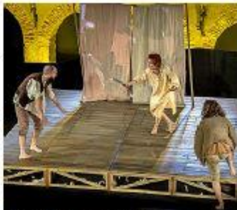
Una escena de la función 'pícaro de pícaros'. / 10

Esa apuesta por los grandes clásicos hace de este ciclo una cita insustituible para los amantes del género, ya que como una de las acciones que prioriza el Claustro es conectar, acercar a los clásicos con la vida de las personas.